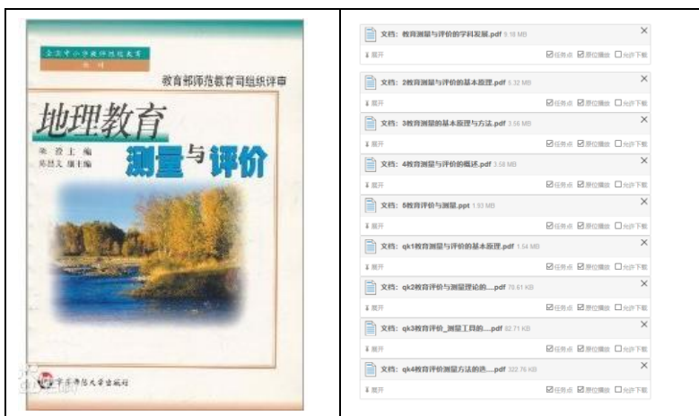
图3 电子教程与拓展教案资料