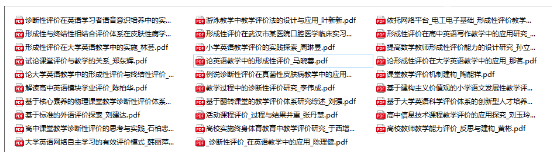
图 6 课程部分相关文献资料截图

研究生阶段要阅读大量的文献，当然也要有效的阅读文献。课程设计过程中我先在中国知网和百度上搜集到各种文献，再进行筛选，上传至课程平台供学生阅读、学习和思考。部分文献资料如图 6 所示。