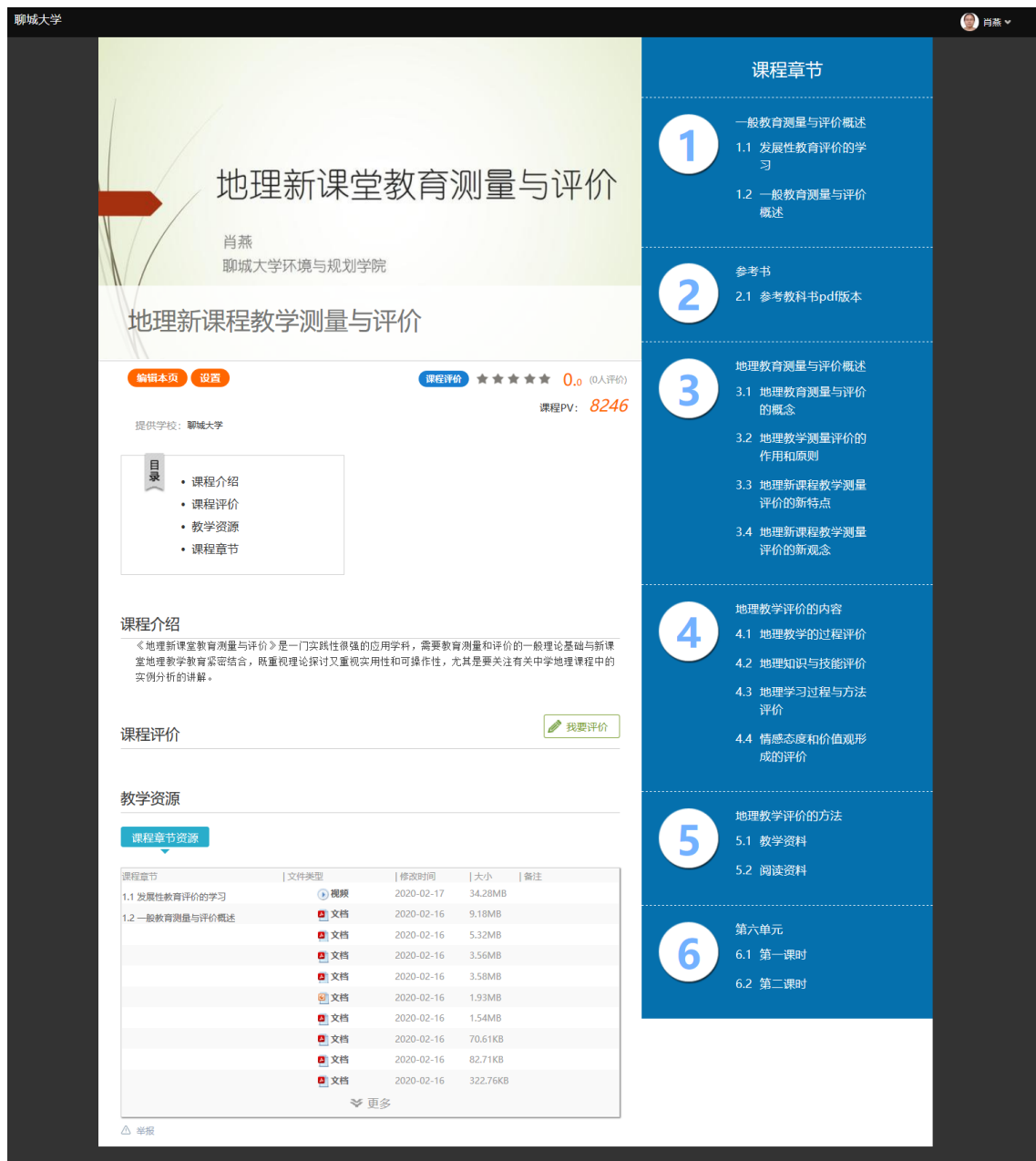
图 2 课程门户网站首页